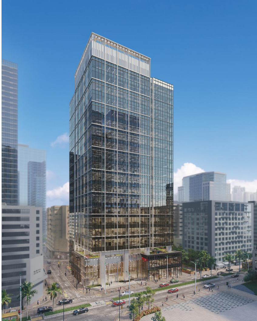
图片一：楼高 23 层的九龙东全新地标式商业综合项目「THE CENDAS」外观时尚中流露高雅格调，特设有 30 米宽阔大门入口宛如自成一国屹立于九龙湾常悦道 15 号。