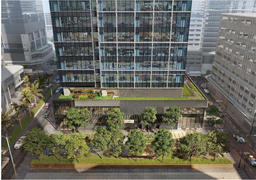
图片二：三边面向大街并依傍着绿化休憩处呈现出一种融合都市繁华与自然静谧的独特氛围，彰显了「THE CENDAS」作为地标商厦的尊贵。