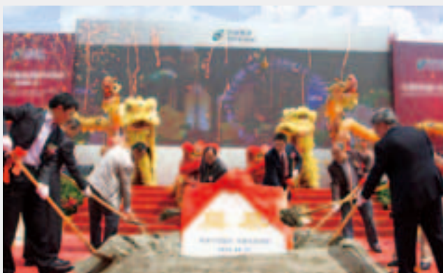
■ 龍泉項目(奠基典禮)

本集團已於二零一二年十二月向當地政府遞交地盤面積為506,000平方米之龍泉項目之總發展藍圖。該項目之前期地盤工程已經竣工，而第一期項目之地盤平整工程計劃將於二零一三年第三季動工。