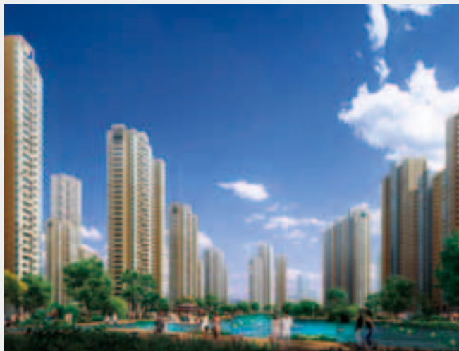
■ 東滙名城 (概念圖)

有關位於中國大陸之發展項目，開封項目之第一期工程正在進行。約1,200個住宅單位將在今年第四季推出發售，定價將符合目前之市場競爭形勢。由於該項目之土地以優惠之條款購入，預計該項目將為本集團提供可觀之潛在回報。龍泉項目之總發展藍圖現已獲批准，預期該項目之第一期將於二零一四年年中開始預售。