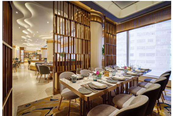
香港銅鑼灣皇冠假日酒店