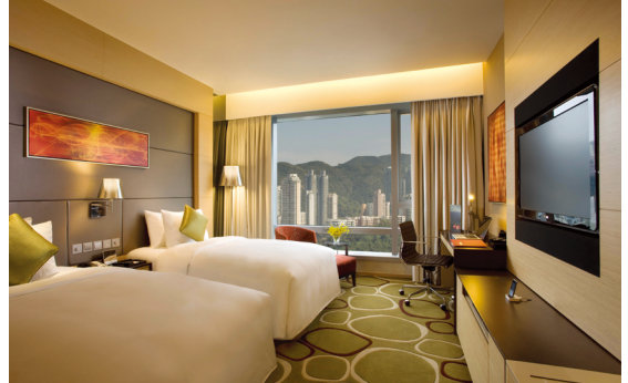
香港銅鑼灣皇冠假日酒店

於本期間，本集團在高息環境及經濟低迷下繼續維持高度財務靈活性及流動性。隨著香港政府取消所有樓市收緊措施，維港滙展現強勁的銷售勢頭，令本集團持續地從該項目收取可觀的現金回報。本集團來自其他投資項目及酒店的穩健現金流進一步加強我們降低資產與負債比率及融資成本的能力。展望未來，本集團預期於二零二六年前不會有重大的再融資需求。此等因素表明本集團具備充足的財務靈活性及流動資金。