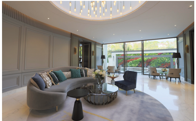
香港壽臣山道東1號