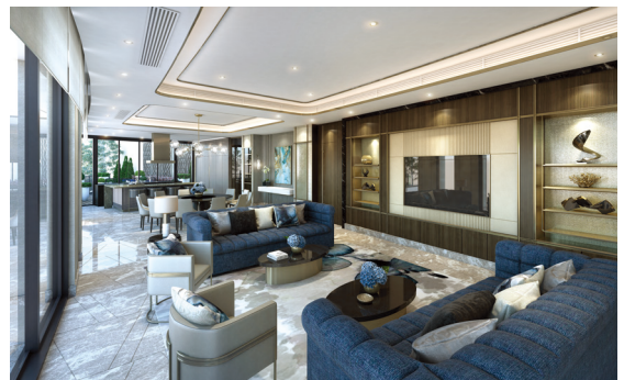
香港壽臣山道東 1 號

外部情勢依然複雜，地緣政治緊張局勢持續影響貿易和金融流動，可能擾亂全球供應鏈。儘管如此，全球經濟在過去數月展現韌力，在通貨膨脹逐漸回到目標水平的情況下，仍維持穩定增長。儘管減息時間與幅度仍不確定，市場普遍認為美國聯邦儲備局將於今年開始減息。雖然預期高息仍會持續，但轉向降息的趨勢將改善全球經濟氣氛。根據國際貨幣基金組織二零二四年七月的《世界經濟展望》，預測二零二四年全球經濟增長為 3.2%，二零二五年則為 3.3%。