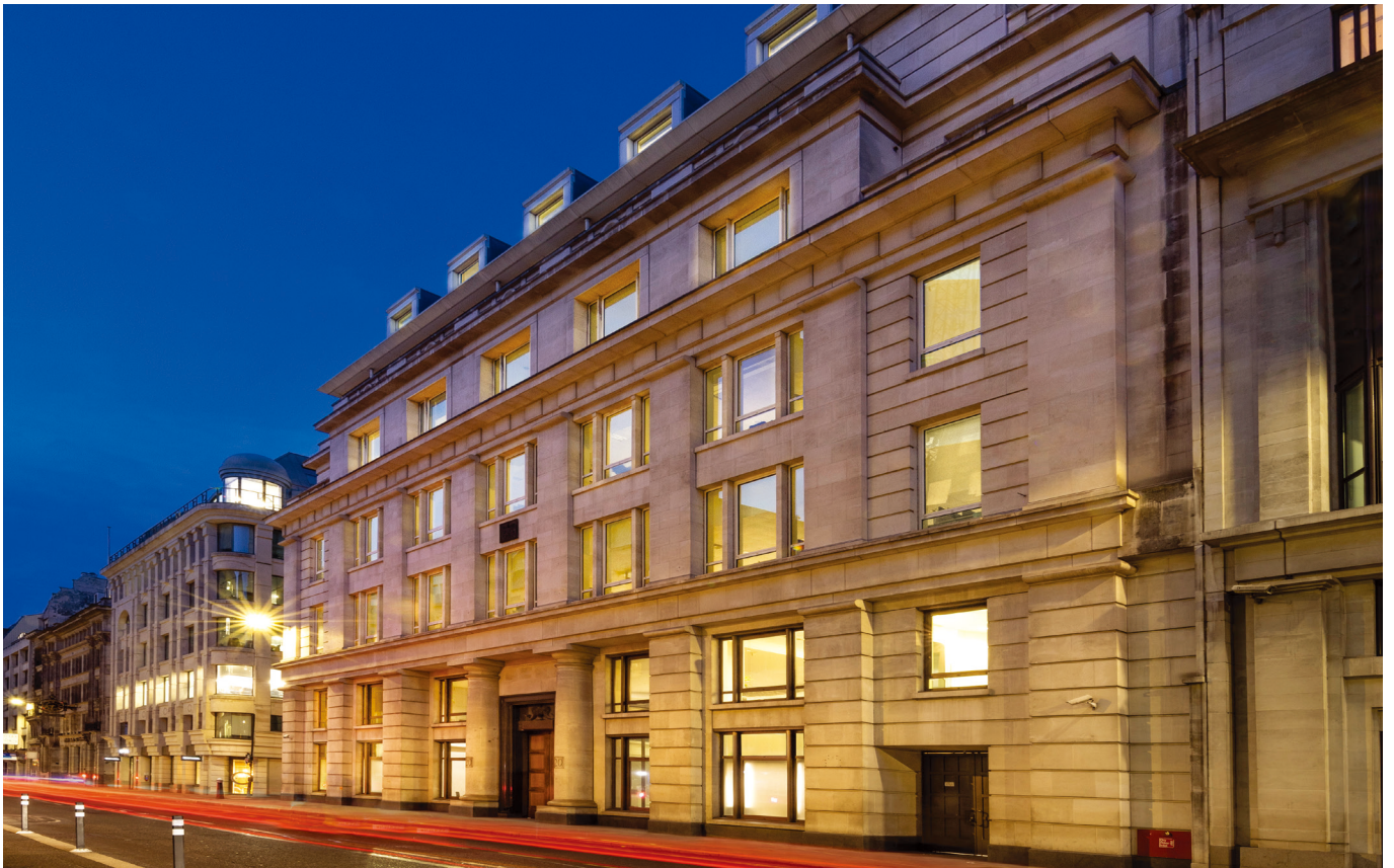
倫敦 20 Moorgate